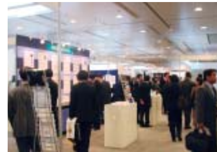
賑わいをみせた展示会場