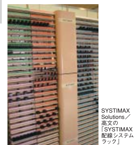
SYSTIMAX Solutions/高文の「SYSTIMAX 配線システムラック」