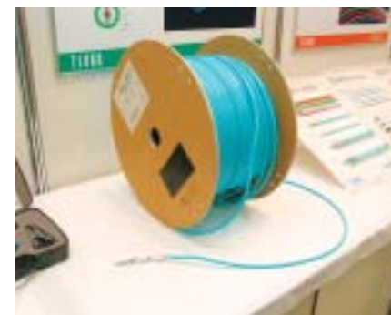
通信興業の「CAT6 ScTPケーブル」

展示会場には44社2団体1メディアが出展。各種ケーブルやコネクタなどの部材から配線システムラックや測定機器まで、ネットワーク工事全般に関連する製品が紹介されていた。特に、ギガビットイーサネットをメタルケーブルで実現できるカテゴリー6(CAT6)が2004年6月にJIS規格となったことから、対応製品が目立った。