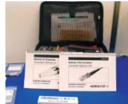
サンコーテレコムの「Optimax工具キット」