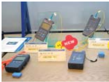
横河電機の光パワーメーター「AQ2160-01」(前)「AQ2160-02」(左)、LD光源「AQ4270-01」(右)