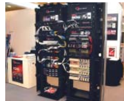
ザ・シーモン・カンパニーの「10Gipトータルソリューションシステム」

SYSTIMAX Solutions/高文は、UTP/光ファイバー配線ソリューションの「GigaSPEED XLソリューション」や、「SYSTIMAX 配線システムラック