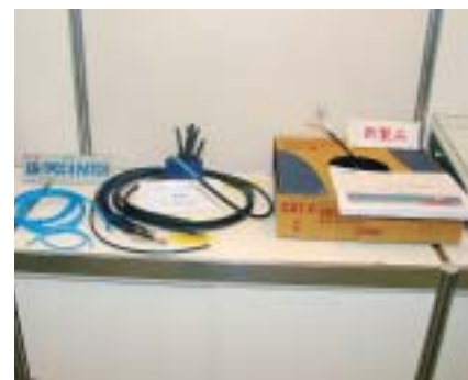
富士電線の屋外用CAT.6ケーブル「TPCC6-LAP」(左)とシールド付CAT.6ケーブル「FS-TPCC6」