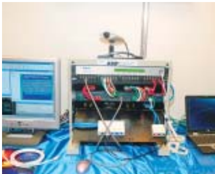
タイコ エレクトロニクスアンプの「AMPTRAC」