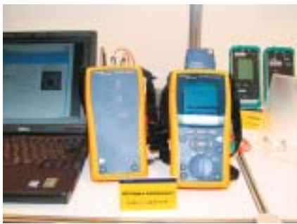
フルーク・ネットワークスの「DTXデジタルケーブルアナライザー」