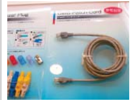
タイトンの「Cat6パッチコード」