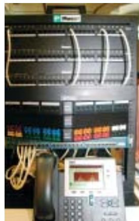
バンドウイット コーポレーション 日本支社の 「PoE対応 パッチパネル」

ワークスが、ケーブルテスターの「DTXケーブルアナライザー」などを展示。新製品の光ファイバーテストツール「EtherScope」が目を引いた。