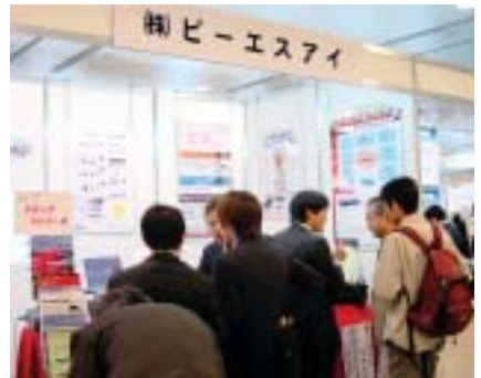
賑わいをみせるビーエスアイの展示ブース