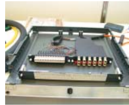
コーニング ケーブルシステムズインターナショナルコープの「10GbE対応ネットワークソリューション」