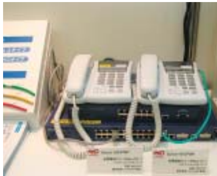
松下電工の給電機能付ハブ「Switch-M24PWR」(左)と「Switch-M12PWR」