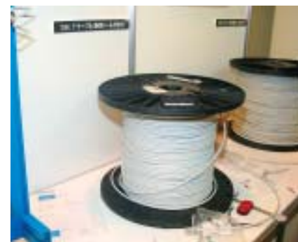
R&Mマーケティング・ホールディング日本支社の「Cat.7ケーブル(各対シールド付き)」

光ファイバーケーブルで目を引いたのは富士電線だ。同社は昨年、IEEE802.3ae規格の「10GBASE-SR」に準拠した「10Gbit Fiber 300シリーズ」を展示したが、今年は10G伝送